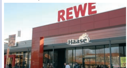
Der neue Rewe Markt verfügt über eine Verkaufsfläche von mehr als 2000 m 2