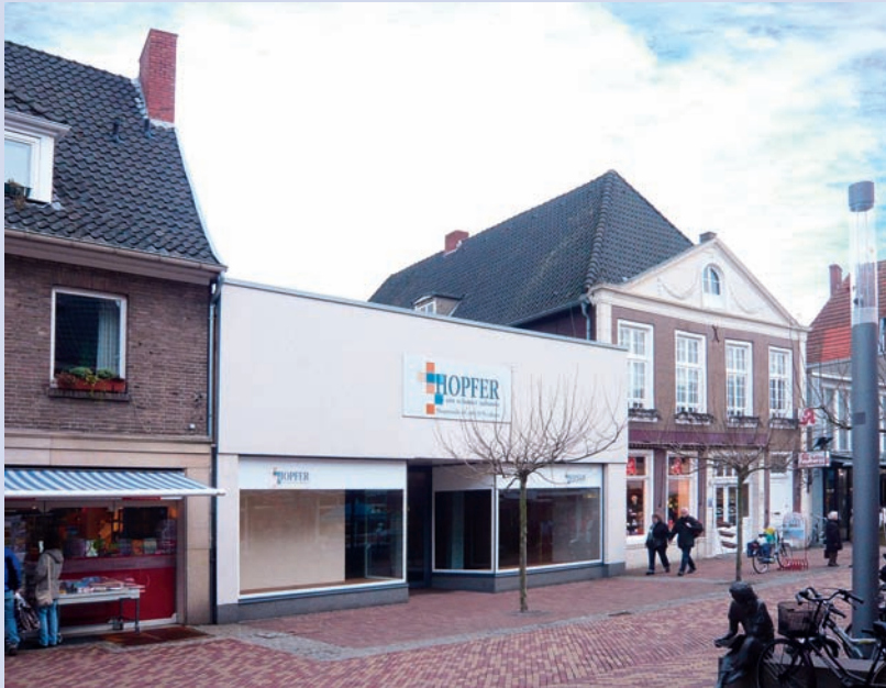
Das Gebäude vor Abriss (oben) und die künftige Fassadenansicht von der Hagenstraße (unten).